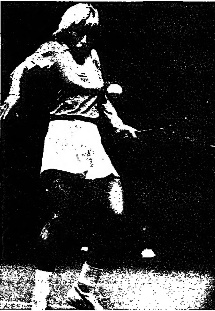
اللاعبة ماريتينا نافراتيلوفا (ب. راديو خاص)

ذاتت اللعبة الاميركية الثالثة كاتي هورفانت اسم وللمرة الاولى مرارة التعرض لهزيمة امل لاجبة تصغرها بحوالي ٥ سنوات وذلك في تصفيات الدور الاول لبطولة فلوريدا لكرة المضرب. هورفانت (١٩ عاماً) احتلت المرتبة ٢٩ في التصنيف العالمي وخسرت مبارياتها ٦-١، ٦-٣ امل الارгентينية غريبيلا سافاتيني (١٤ عاماً) المشاركة برابع بطولة عالمية لها. وقد صعدت سافاتيني بذلك الى الدور الثاني لتتقدم بذلك الى البطولة الثالثة كارتينا نافراتيلوفا (١٥ عاماً) التي فازت على اللينورويكي جيجي فيرنانديز ٦-١، ٦-٤. وعلى صعيد التصنيفات فازت الاميركية لوري مكنتيل على الدانماركية تينا شور لارسن ٦-١، ٦-٣. والرومانية فيرجينيا روزيتي على الاميركية كيم شلوفر ٧-٦، ٧-٦. والاميركية ستيفاني ريه على البرازيلية بت مديراو ٦-٢، ٦-٢. والاميركية جيني بوردي على الالمانية الجنوبية بيغري مولد ٦-١، ٦-٢. شارون والش على البيروفية لورا اوريا غيلمفست ٧-٦، ٣-٥. واليوغوسلافية سبيريلا غولز على الاميركية جوان راسل ٦-١، ٦-٢. والنمساوية ليليان مريش على الاميركية بريارة جوردان ٦-١، ٦-٢. والاميركية فيبي تلسون على السويسرية كريستيان جوليان ٦-١، ٦-٢. والاميركية كاترينا لنيكويست على الالمانية الشمالية سبيريلا ٧-٥، ٦-٣.